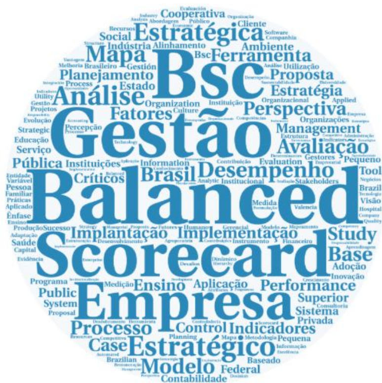
Figura 3: Nuvem de palavras utilizando os títulos dos artigos científicos