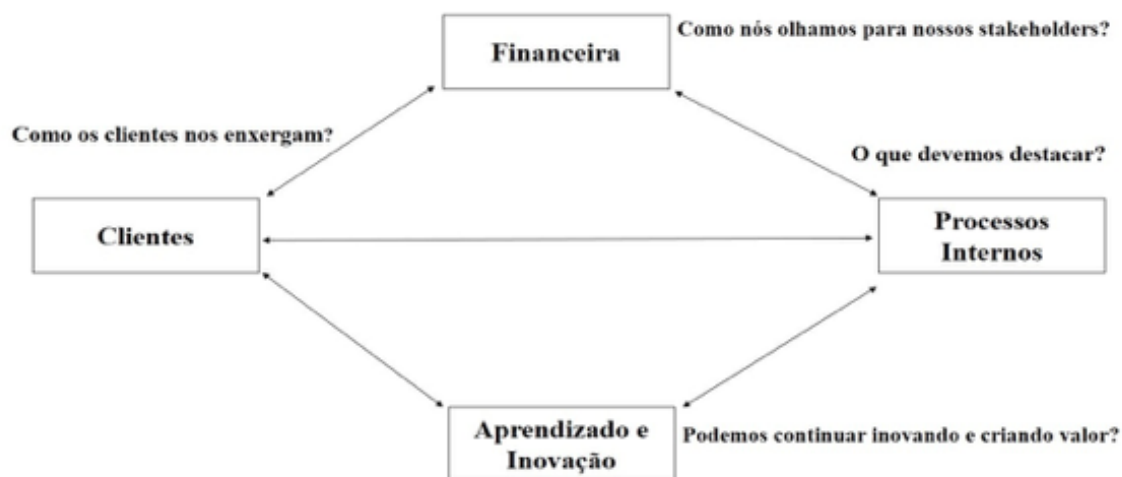
Figura 1: Perspectivas do Balanced Scorecard