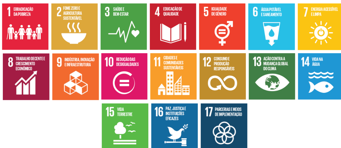
Figura 1 –17 Objetivos de Desenvolvimento Sustentável

A fim de tornar cada nação e pessoa do mundo passíveis de se desenvolver, os Estados-membros da ONU, em 2015, atestaram que a pobreza é o maior desafio global e sua erradicação seria um requisito imprescindível para a efetivação do direito ao desenvolvimento. Isso posto, eles desenvolveram a “Agenda 2030”, que consiste em uma agenda global de desenvolvimento, ou seja, é um plano de ação com “medidas ousadas e transformadoras para pôr o mundo em um caminho sustentável e robusto - sem deixar ninguém para trás”. São 17 Objetivos de Desenvolvimento Sustentável, os “ODS”, e 169 metas com a finalidade de acabar com a pobreza, garantindo o bem-estar de todos os seres humanos sem degradar o planeta. Os objetivos atingem as áreas fundamentais para o desenvolvimento humano integral, e são eles (PNUD BRASIL, 2015):